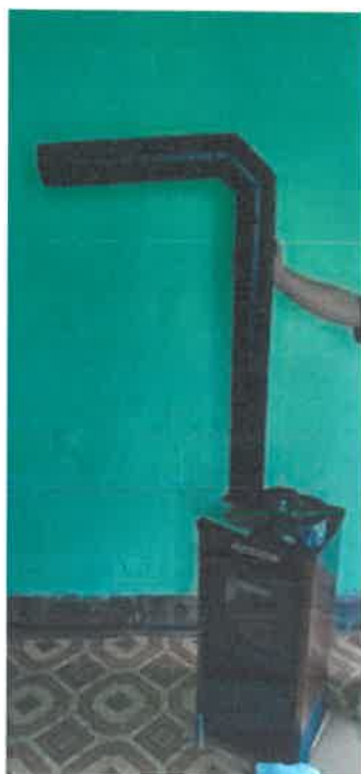
2 db kályha is megvásárlásra került 195 200,- Ft értékben.

A Mátészalkai Városgazda Nonprofit Kft. alvállalkozó bevonásával és saját kivitelezésben több önkormányzati tulajdonban lévő lakás felújítását is elvégezte, azok bérbeadása előtt. A bérlakásállomány legkorszerűbb és legjelentősebb vagyoni hányadát kitevő ingatlanok állagmegóvása kiemelt jelentőségű.