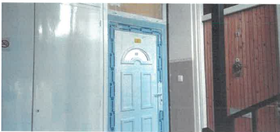
Régi, rossz állapotú nyílászárók cseréje az Alkotmány út 38. 3/10. szám alatti bérlakásban.

Nyár út 5. szám alatti ingatlanon is ráfordítással járó felújítás történt, a háború elől menekülők befogadására, elhelyezésére saját kivitelezésben. Az épületben elvégzett feladatok a teljesség igénye nélkül: festés, nyílászárók festése, kazán felújítása, udvar tereprendezése, csatorna részleges felújítása, záruk cseréje, internetbekötés. A felújítási munkákon felül eszközbeszerzések is megvalósultak a befogadásra alkalmassá tétel érdekében: konyhai kis-, és nagygépek vásárlása (mosógép, hűtőszekrény, mikrohullámú sütő), szén-monoxid érzékelő, router. A használat során a közüzemi költségek összege is jelentős volt.