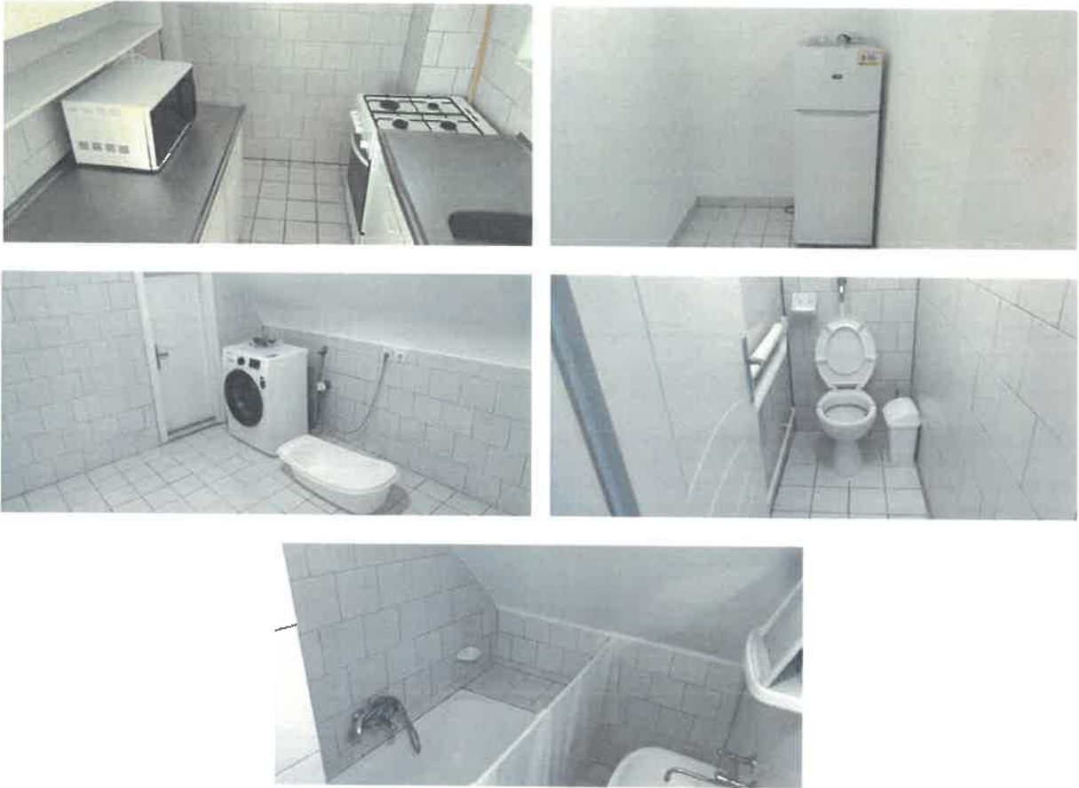
Nyár út 5. szám alatti ingatlan felújított állapotban

Ügyfélszolgálatunkon a 2022. évben hetven alkalommal tettek személyesen vagy telefonon ingatlankezeléshez kapcsolódó hibabejelentést ügyfeleink. Munkatársaink az ingatlankezelési szabályzatunk alapján, prioritásuknak megfelelő sorrendben igyekeztek a hibákat elhárítani.