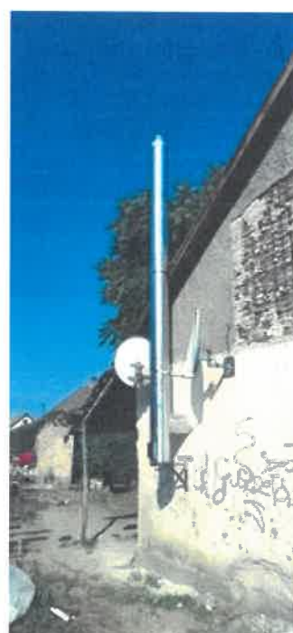
Duplafalú saválló szigetelt kémények beépítésének kivitelezése