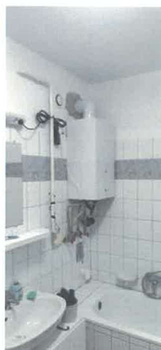
Zárt égésterű kazán felszerelése az Alkotmány út 2/A és 2/B lakásokban

105 db önkormányzati bérlakás kéményseprői felülvizsgálata történt meg a Katasztrófavédelem által. Ezzel párhuzamosan általunk is készültek műszaki állapotfelmérések az ingatlanokkal kapcsolatban. Az Országos Katasztrófavédelmi Főigazgatóság évenkénti kötelező felülvizsgálata során megállapításra